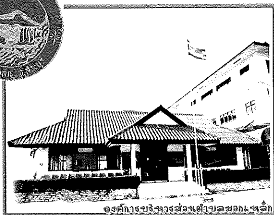
องค์การบริหารส่วนตำบลมวกเหล็ก